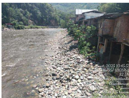
Fotografía N° 1: C.P PAUCARTAMBO, se observa que el rio Paucartambo se observa la poblacion expuesta en la margen dercha del rio.