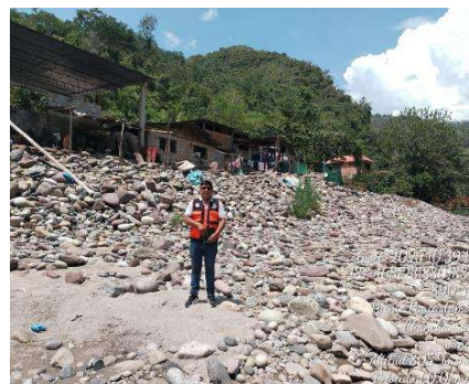
Fotografía 2: C.P Puente Paucartambo, se observa la poblacion expuesta a inundacion margen derecha del rio Paucartambo.